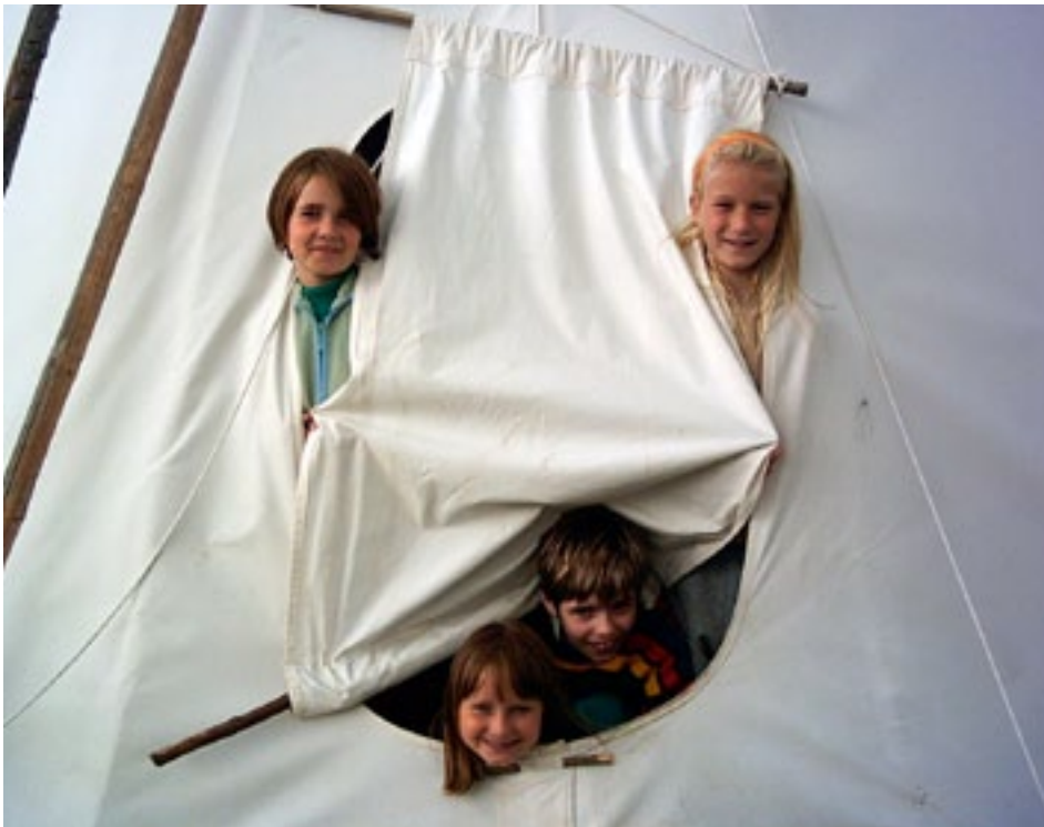
Dětský hospic slouží také jako zázemí pro každoroční letní tábory, pořádané Nadačním fondem Klíček. Kdo může, spí ve stanu na zahradě za domem, komu to zdravotní stav nedovoluje, bydlí pod střechem.

a někteří vzdělávatelé, například zdravotnické školy, ale i ministerstvo zdravotnictví, kde jsme měli velký seminář pro vrchní a staniční sestry z dětských nemocničních oddělení. A co bylo důležité – neztratili jsme kontakt s dětmi v nemocnicích. Chodili jsme za nimi jako dobrovolníci, později jako herní specialisté. V roce 1993 jsme z podnětu rodičů a na základě toho, co jsme sami poznali, založili v areálu motolské nemocnice malou ubytovnu. Nejdřív jsme chtěli rodičům hospitalizovaných dětí, kteří nebyli z Prahy, nabídnout střechem nad hlavou. Později jsme z rozhovorů s nimi zjišťovali, co kromě místa k nocování nejvíce potřebují.