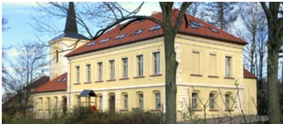
Budova bývalé školy v Malejovicích u Uhlířských Janovic, kde od léta 2004 funguje první část dětského hospice Nadačního fondu Klíček.