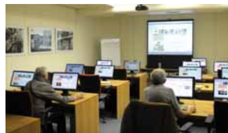
Školička internetu pro seniory v novém centru