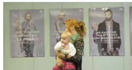
Přípravy na tiskovou konferenci kampaně Mluvme o stáří