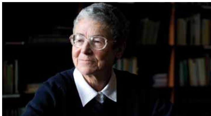
„Snad nejdůležitější brázdou, která by za člověkem měla zůstat, je brázda slušného člověka,“ myslí si Helena Illnerová

Myslím, že docela dobře. Jak člověk stárne, získává velkou pokoru. Samozřejmě že ho zamrzí, že to či ono už nemůže dělat jako zmlada, třeba sjíždět na lyžích prudké kopce a nechat si hvízdát vítr ve vlasech, ale na druhou stranu si musí uvědomit, jak byl šťastný, že to vůbec kdy dělat mohl. A měl by za to být vděčný a smířit se s tím, že teď stárne. Pokud ale má zájem o okolí, umí pomáhat a je relativně zdravý, tak se mu může stárnout docela dobře. Důležité je vědomí, že za ním nezůstalo nic, za co by se musel pronikavě stydět.