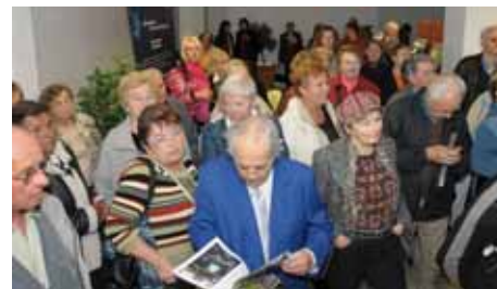
Partneři a klienti Elpidy plus přišli na slavnostní otevření Centra Elpida