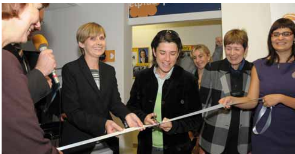
Před startem kampaně Elpida plus slavnostně otevřela nové Centrum Elpida pro seniory v Praze 4