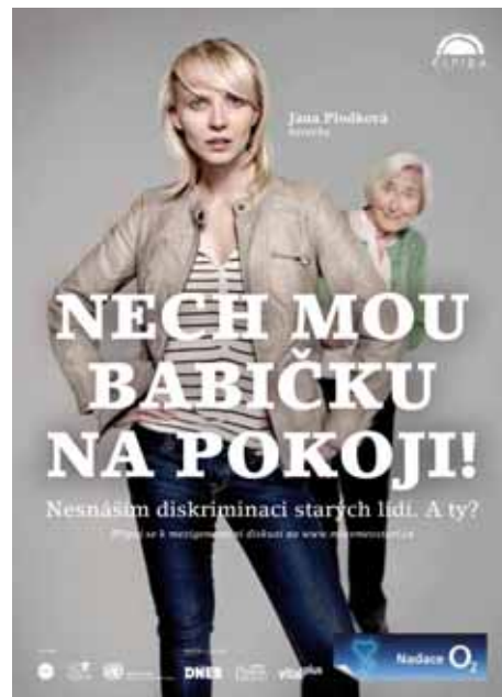
Vizuál kampaně Mluvme o stáří