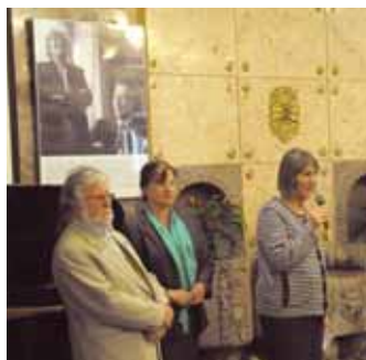
Vernisáž výstavy fotografií o Olze Havlové v Kavárně Lucerna