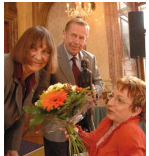
Dana Němcová s Václavem Havlem předávají Cenu Olgy Havlové

Víra je pro mě dar. Něco, k čemu jsem přišla „jako slepý k houslím“ a co jsem si